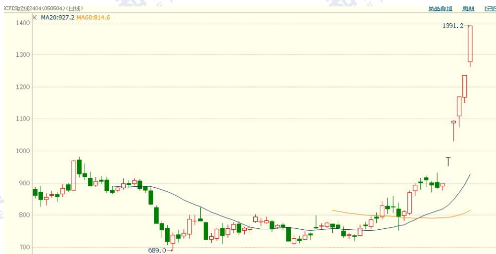
图 1：集运欧线期货价格

本周红海危机仍是引导期价走势的主线。周二一艘集装箱船被袭，红海危机升级，多航司表示绕道好望角，集运欧线 26、27 日再次触及涨停，随着马士基、达飞宣布继续通行苏伊士运河计划，市场担忧情绪降温，周五盘面有所回落。截至本周五，集运欧线 EC2404 合约收盘价 1643 点，周环比上涨 18.1%。