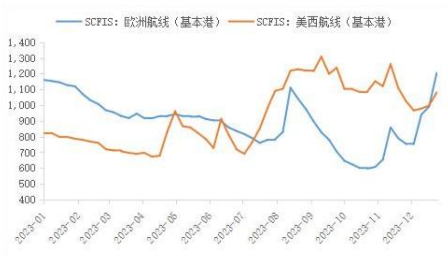
图2：上海出口集装箱结算运价指数

北美航线，据标普全球发布的数据显示，美国12月Markit综合PMI初值51，好于前值和市场预期，创2023年7月以来的新高，其中服务业PMI数据同样创了7月以来的新高，而制造业PMI仍然处于荣枯线下方，服务业的改善抵消了制造业的下滑，显示出美国经济复苏的基础并不稳固。北美航线受到地缘局势风险的影响不大，本周运输需求保持稳定，供需基本面稳固，市场运价继续上涨。12月22日，上海港出口至美西和美东基本港市场运价（海运及海运附加费）分别为1855美元/FEU和2982美元/FEU，分别较上期上涨2.0%、6.3%。