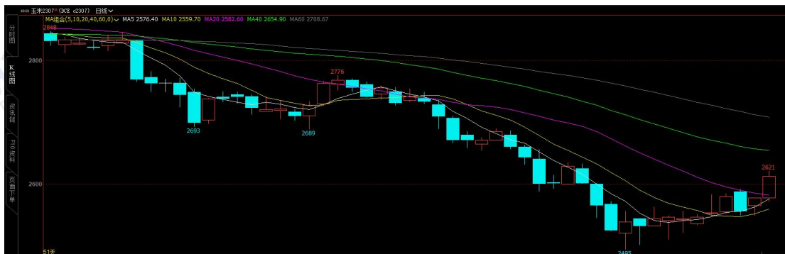
图 1

本周玉米盘面价格震荡上行。本周玉米主力合约 2307 最低收盘价为 2554 元/吨，最高收盘价为 2615 元/吨，周涨幅 2.67%。