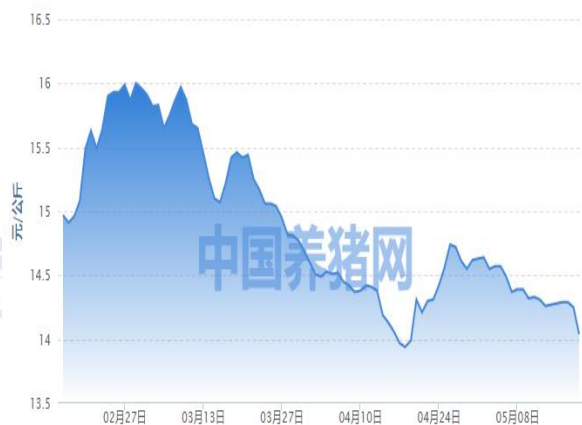
图 1：外三元生猪价格