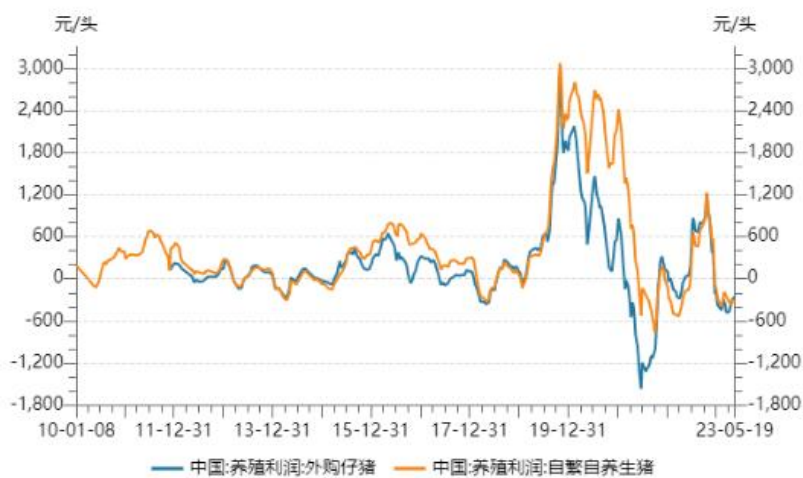
图 5: 生猪养殖利润

截至目前，猪价大部分时间都低于 15 元/公斤，低于盈亏线。而饲料原料端豆粕玉米价格也有所下跌，生猪养殖利润年内持续亏损。据 WIND 数据显示，截至 5 月 19 日，外购仔猪养殖利润亏损 254.57 元/头，自繁自养生猪利润亏损 336.94 元/头。猪料比价为 3.78：1，猪粮比价为 5.30：1。