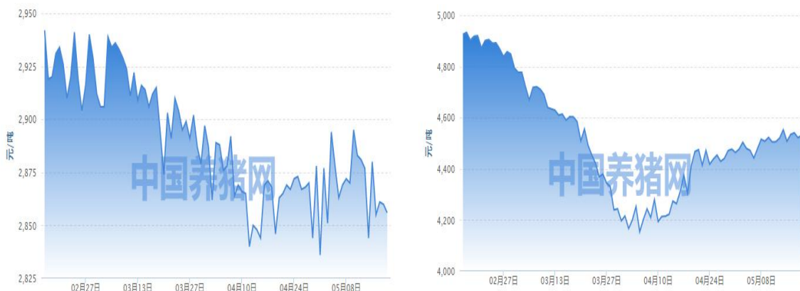
图 4:玉米/豆粕市场均价