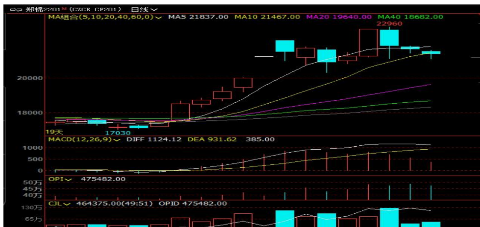
图 1 棉花主力合约 2201 走势图

周初郑棉在新棉成本较高、外盘上涨等利好因素支撑下涨停，之后随着储备棉投放增加、下游观望、多头资金获利止盈，郑棉高位回落。短期技术走势偏空，郑棉仍有回调需求，关注 21000 元/吨附近郑棉主力表现。