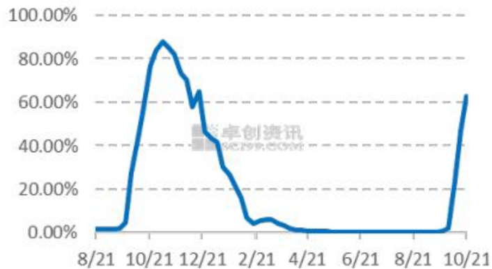
图6 中国轧花企业平均开工率统计

本周国内轧花厂开工负荷 62.81%，较上周上调 15.63%。新疆 2021/22 年度棉花加工全面开始，越来越多的新疆轧花企业恢复正常收购、加工，开工率继续增加。内地天气转晴，籽棉少量上市交易，内地轧花企业维持低开工率加工，个别地区企业因电量原因陷于短期停机状态。