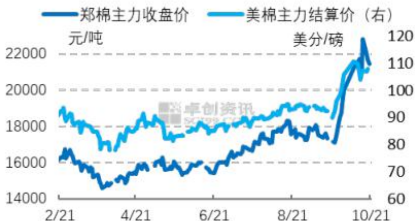
图 2 国内外期货价格走势

本周美棉主力震荡盘整。周内市场多空交织，美棉出口报告不佳、美元走弱、美国谷物价格上涨等因素共同扰动市场，美棉主力 105-111 美分/磅区间震荡。短期美棉主力日线出现“空中加油下跌”信号，关注 106 美分/磅附近美棉主力表现。