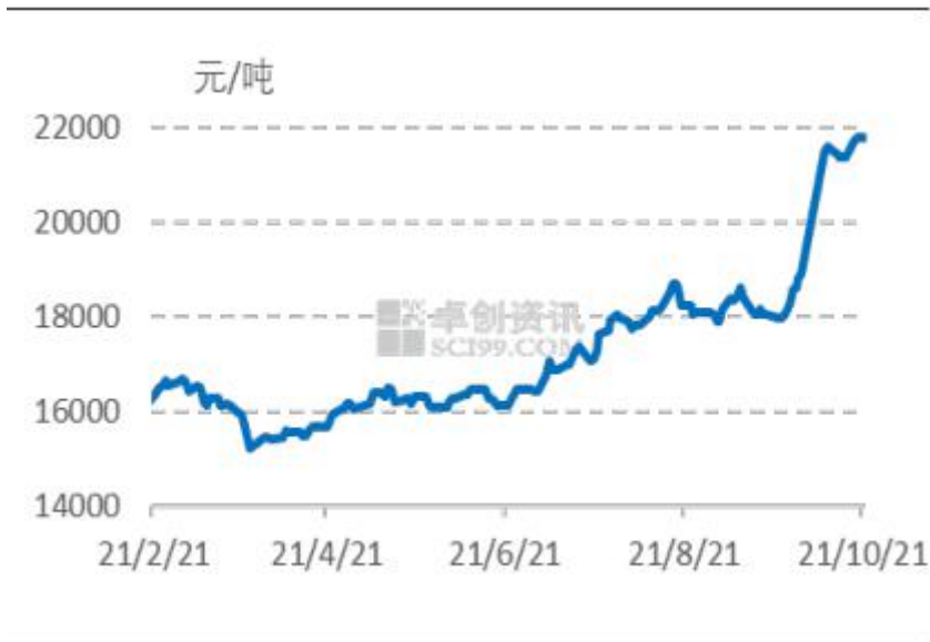
图3 国内 3128B 皮棉均价走势图