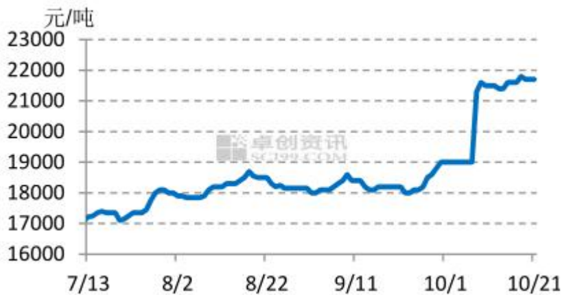
图4 新疆 3128B 级皮棉市场均价

本周新疆 3128 级皮棉价格上涨。周初因郑棉涨停，现货报价随之上调，另外新疆皮棉加工成本居高，且部分地区实际采收有所减产，支撑棉价上扬。周内下游需求不佳，纺企开机下滑，询单采购较少，2021/22 年度新疆机采棉成本多在 23000-26000 元/吨，与期价倒挂，市场暂基本无成交。