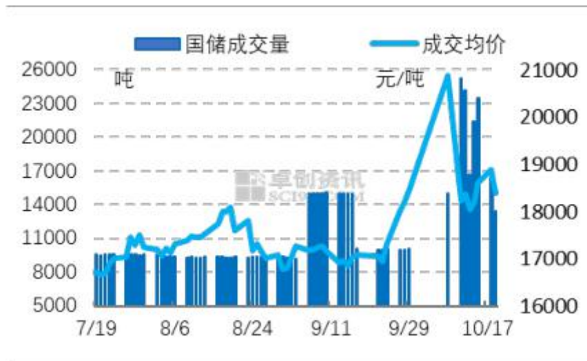
图7 2021年国储棉抛储成交情况

10月19日储备棉投放销售资源 30047.776 吨，实际成交 13409.523 吨，成交率 44.63%。平均成交价格 18387 元/吨，较前一日下跌 501 元/吨，折 3128 价格 20182 元/吨，较前一日下跌 408 元/吨。新疆棉成交均价 18853 元/吨，较前一日下跌 663 元/吨，新疆棉折 3128 价格 20344 元/吨，较前一日下跌 669 元/吨，新疆棉平均加价幅度 465 元/吨。地产棉成交均价 18069 元/吨，较前一日下跌 303 元/吨，地产棉折 3128 价格 20071 元/吨，较前一日下跌 171 元/吨，地产棉平均加价幅度 192 元/吨。10月8日至10月19日累计成交总量 155800.679 吨，成交率 79.49%。