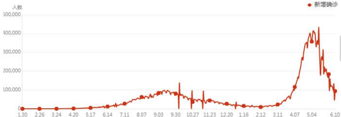
印度疫情新增确诊趋势图