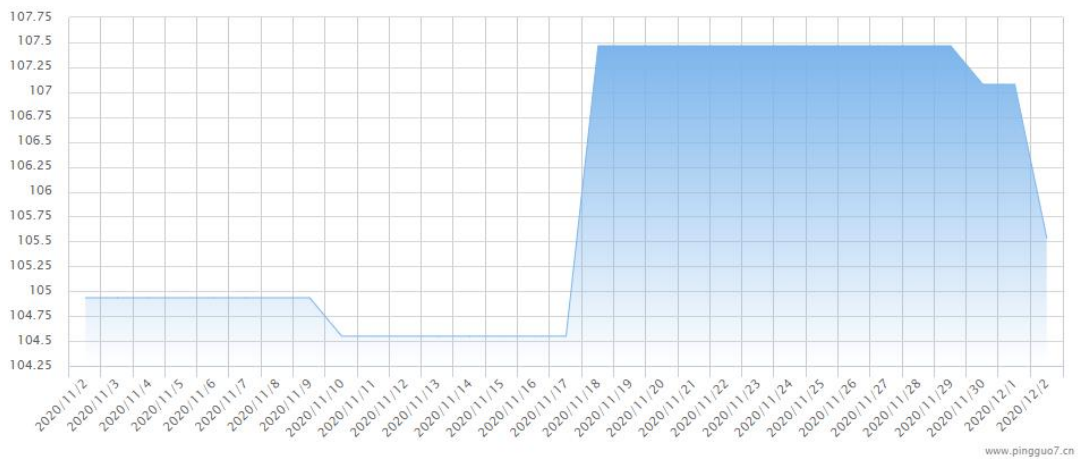
图3 产区苹果（红富士）价格指数