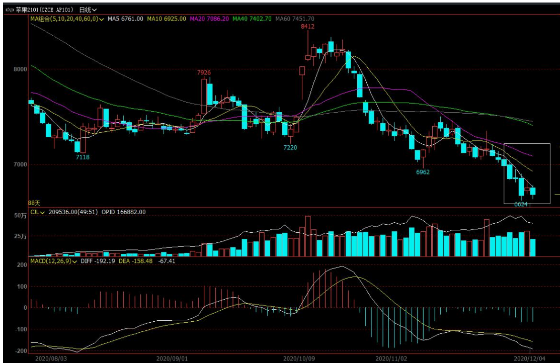
图4 主力合约AP101行情走势

周五苹果期货主力2101合约盘面震荡偏弱，收盘价6681，较上一交易日-1.36%；成交量209536手；持仓166882手，-5714手（单边计算）。