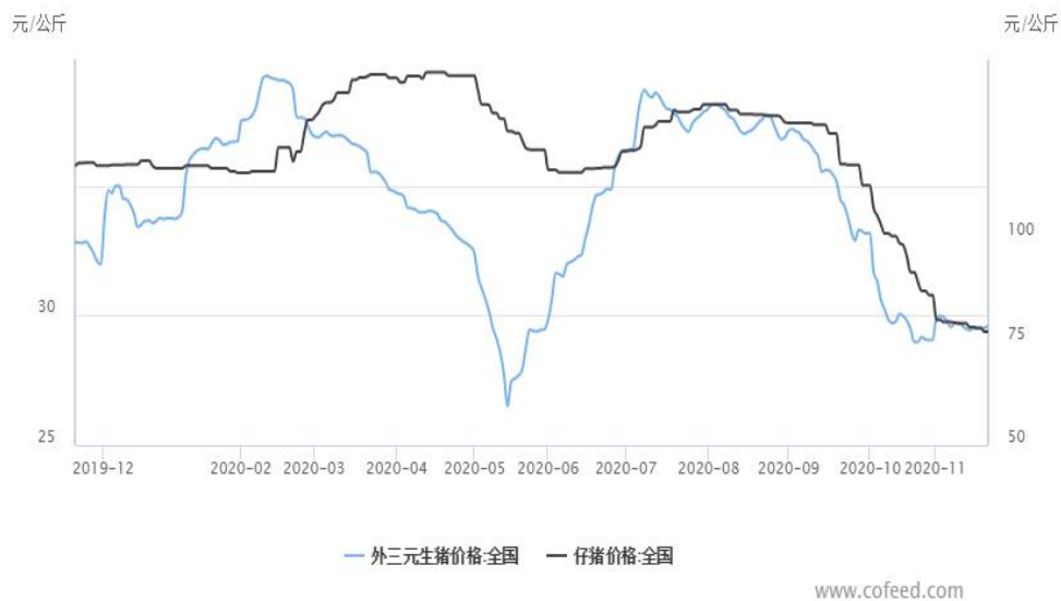
图 1 生猪现货价格及仔猪价格

本周（20201116-20201120）生猪价格小幅反弹，仔猪价格继续回落。截止本周五，全国外三元生猪现货价格为 29.59 元/公斤，较上周五上涨 0.15 元/公斤，涨幅 0.51%；仔猪现货价格 77.35 元/公斤，较上周五下跌 1.11 元/公斤，跌幅 1.41%。