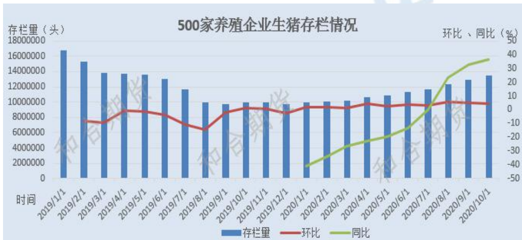
图 2 全国 500 家养殖企业生猪存栏情况

生猪市场供应显著增加，猪肉价格连续两个多月大幅回落。从仔猪到肥猪育肥周期一般为 6 个月。前期新增产能逐步释放，上市肥猪供应显著增加。今年 9 月份生猪出栏同比首次由降转增，这是出栏下降 25 个月后首次同比增长。10 月份同比增长 38.5%，增幅继续扩大，猪肉市场供应明显改善。9 月份以来，猪肉价格已连续两个多月下降。11 月份第 2 周，全国集贸市场猪肉价格回落至每公斤 46.47 元，同比下降 18.0%，比 2 月份第 3 周的最高价格回落 13 元多。