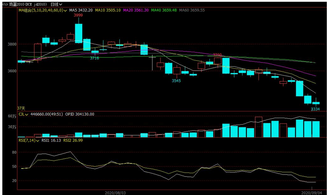
数据来源：文华财经 和合期货

本周五，鸡蛋主力合约 2010 震荡偏弱，收盘价 3352，涨幅-0.92%，成交量 446660 手，今日持仓量 304130 手，-10848 手（单边计算）。