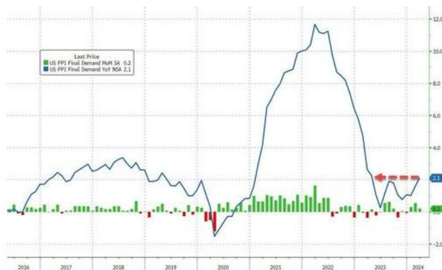
图 6: 美国 PPI 走势