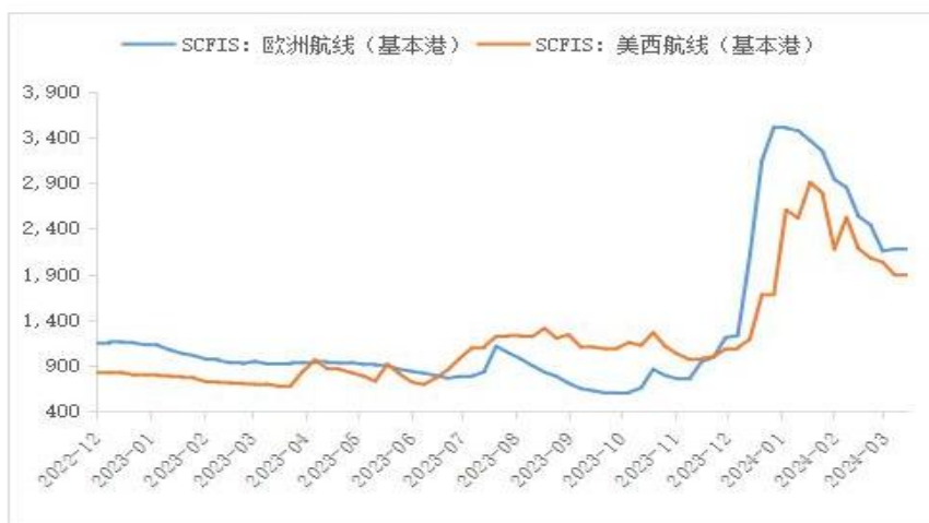
图 3：上海出口集装箱结算运价指数