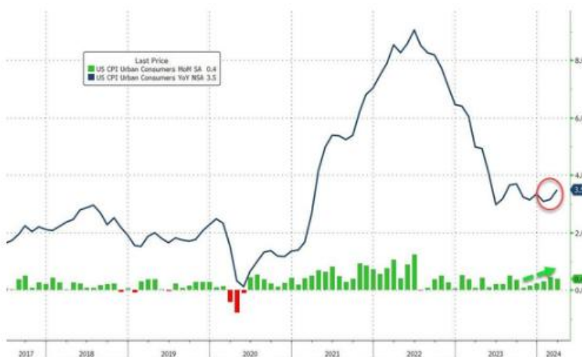
图 5: 美国 CPI 走势