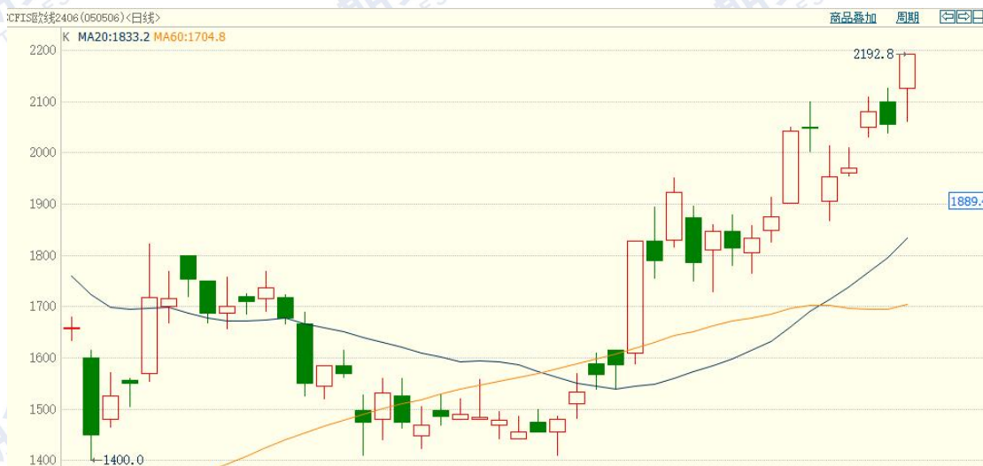
图 1：集运欧线期货价格

周内多家航司上调集运运价，叠加地缘政治危机引导市场情绪，集运欧线周内偏强运行。截至本周五，集运欧线 EC2406 合约收盘价 2192 点，周环比上涨 7.08%。