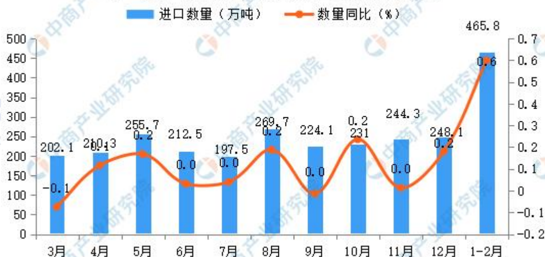
2024年1-2月中国铜矿砂及其精矿进口量及增长情况

海关总署数据显示，2024年1-2月中国铜矿砂及其精矿进口量为465.8万吨，去年同期为462.8万吨，同比微增0.6%。