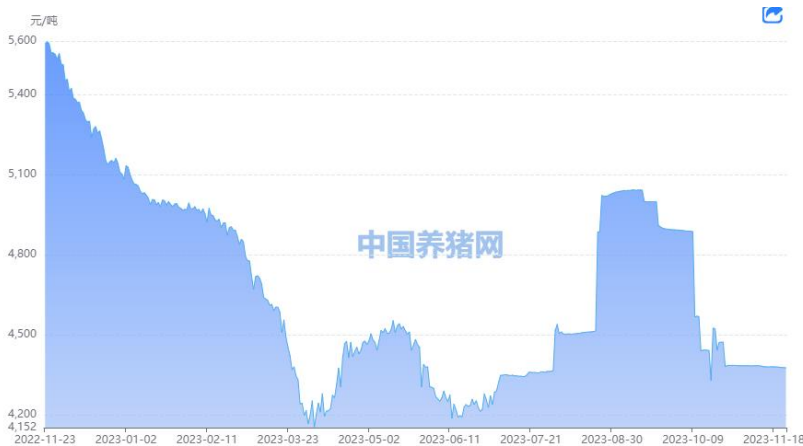
图 6: 豆粕市场价格

最新天气预报显示，未来两周南美或迎来降雨，大豆承压。咨询机构称，尽管存在天气问题，但 2023/24 年度巴西大豆产量预计将达到创纪录的 1.616 亿吨。粮商巨头 ADM 公司表示，巴西的恶劣天气给 2023/24 年度大豆生产敲响了警钟，但产量仍有望创下历史最高纪录，豆粕市场短期承压。据中国养猪网数据显示，11 月 24 日豆粕价格为 4369 元/吨，较上周五下跌 5 元/吨。