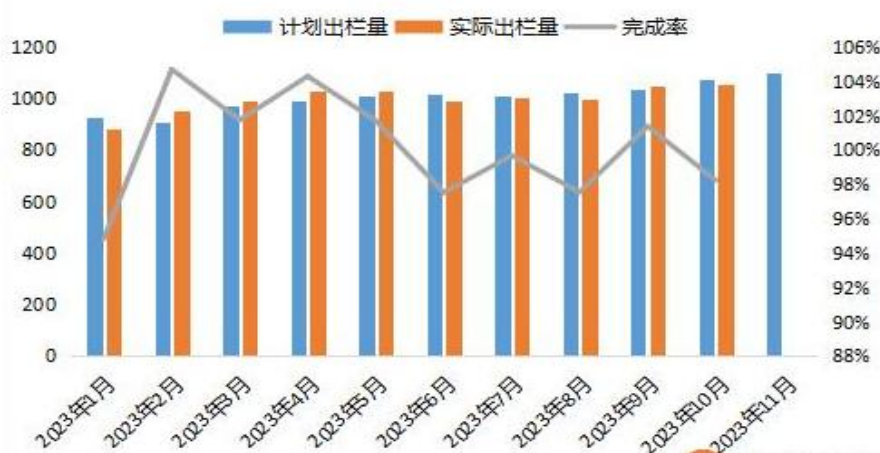
图 4：2023 年养殖企业生猪出栏量情况