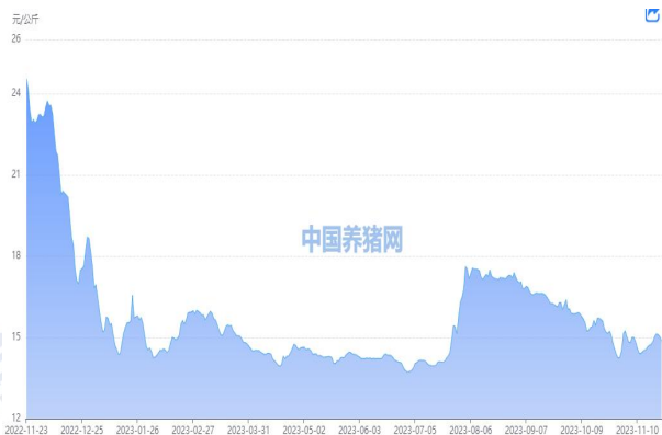
图 1：外三元生猪价格