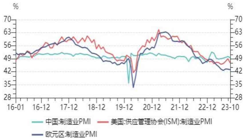
图 8：主要国家 PMI

11 月美联储如期暂停加息，但近日鲍威尔放鹰发言，没有信心货币政策已足够紧缩，必要时将毫不犹豫加息。美国降息预期减弱，而欧洲经济衰退风险并未解除，欧元区 11 月投资者信心指数录得-18.6，上升幅度超过预期，但仍处负值。欧洲进口需求仍显疲态，市场更加期待感恩节与圣诞节对需求的拉动。