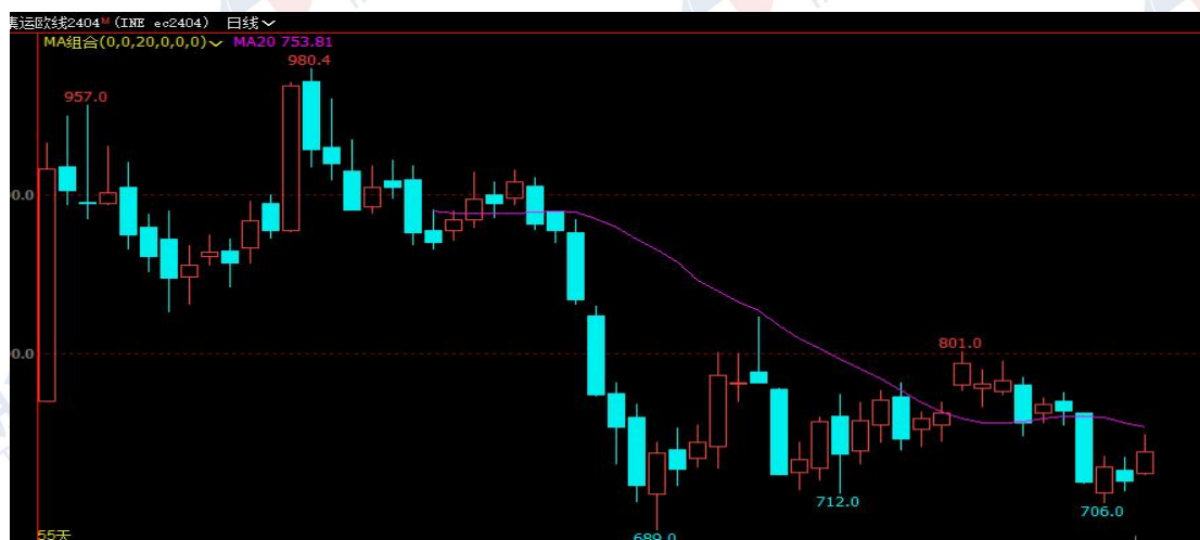
图 1：集运欧线期货价格