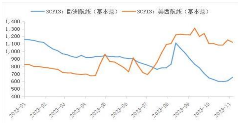
图 2：上海出口集装箱结算运价指数