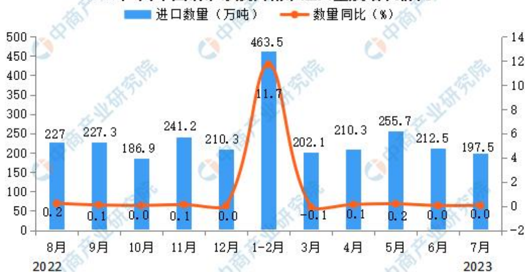
2023年7月中国铜矿砂及其精矿进口量及增长情况

海关总署 9 月 7 日数据显示，8 月我国铜矿砂及其精矿进口量为 269.7 万吨，进口创下 2008 年以来最高记录，我国 1-8 月铜矿砂及其精矿进口量为 1,810.4 吨，同比增长 9.0%。