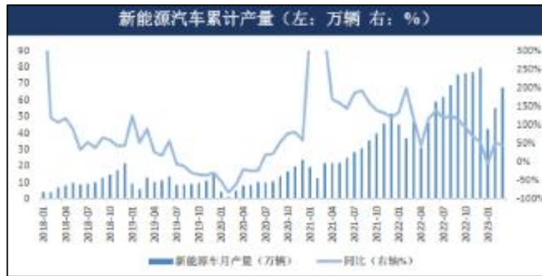
图 7：新能源汽车累计产量