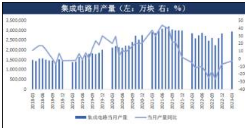
图 6：集成电路月产量