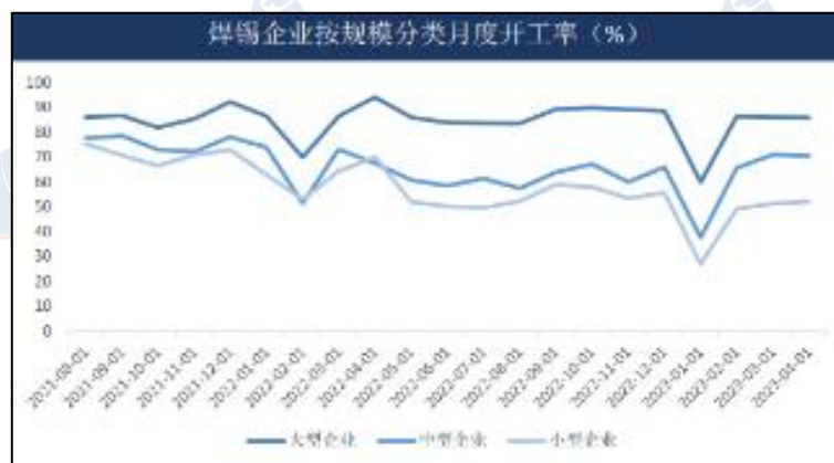
图 5：中国锡焊企业开工率

国内焊料企业订单依旧较差，有季节性淡季原因，也有外贸形势不乐观的因素。光伏焊带整体消费稳定。焊料企业6月开工率继续回落。7月第一周铅蓄企业开工周环比持平。总体来看，需求端依然偏弱。