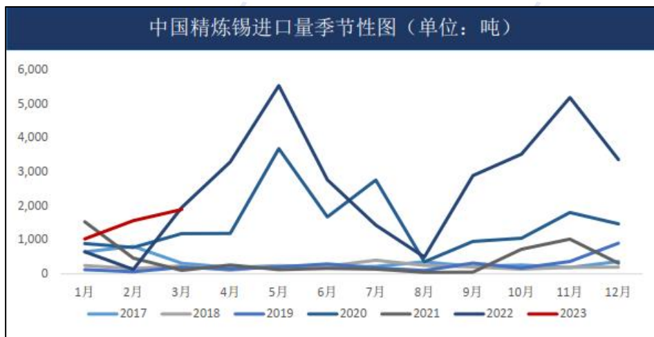
图 4：我国精炼锡进口量

紧缺因素减产、安徽某冶炼企业产量减少影响。不过进入7月份，云南某冶炼企业表示由于锡矿采购紧缺而减量、江西某冶炼企业产量略微恢复、广东某冶炼企业复产，预期7月份国内精炼锡产量为14140吨，基本持平于6月份产量。不过8月份缅甸佤邦禁矿有潜在可能，若果施行将导致国内锡矿供应量面临较大缺口，令本就偏紧的锡矿资源雪上加霜。