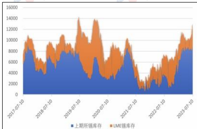
图 8：LME 及上期所锡库存