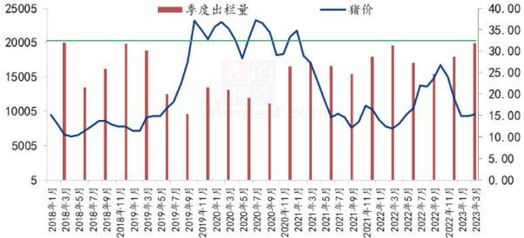
猪价出栏量与猪价走势对比 单位：万头、元/公斤