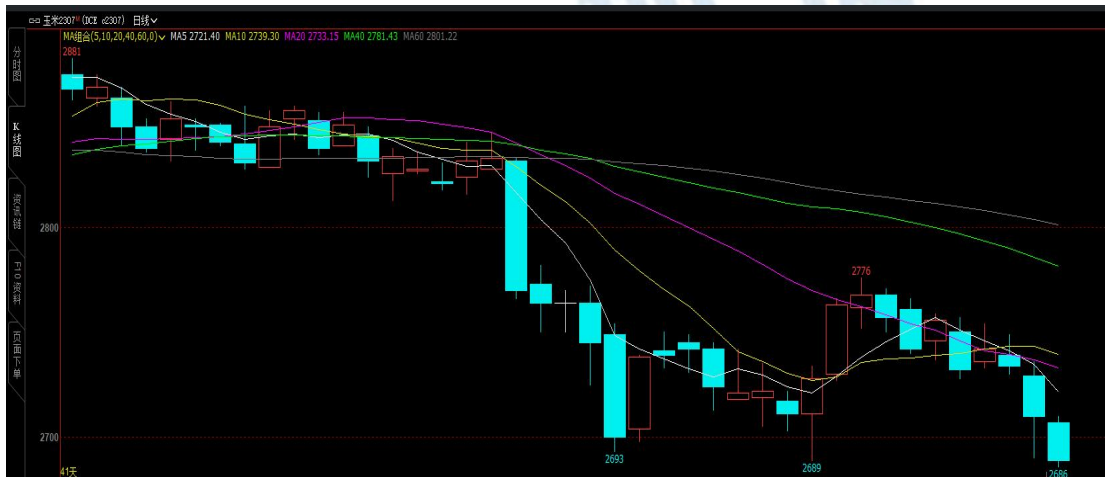
图 1 数据来源：博易大师

本周玉米盘面价格震荡整理。本周玉米主力合约 2307 最低收盘价为 2672 元/吨，最高收盘价为 2742 元/吨，周跌幅 3.05%。