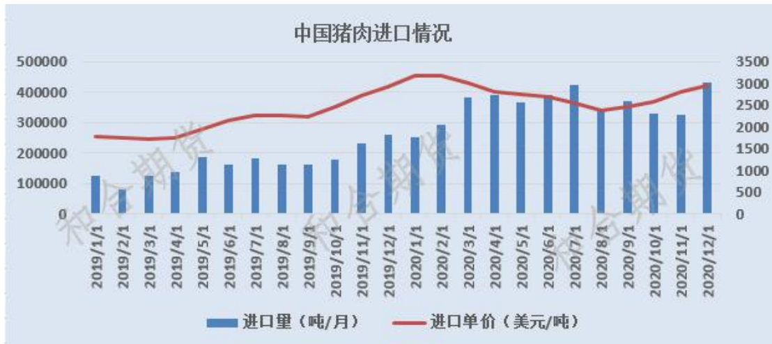
图 3 我国猪肉进口情况