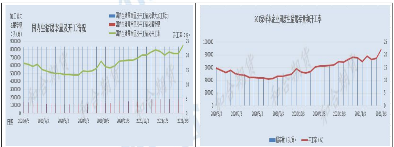
图5 生猪屠宰及开工情况

随着春节临近，猪肉消费步入需求最旺季，导致终端需求逐步增多尤其对大猪需求的明显增加。从屠宰量及开工率来看，环比前一周大幅上涨。截止2月3日，全国主要监测屠宰企业生猪屠宰量为1980942头，较上周增加235107头，增幅高达13.5%，本周开工率为23.69%，较上周增加2.81%。从201家样本企业周度生猪屠宰量和开工率来看，截止本周2月3日，屠宰量为875311头，较上周增加132591头，增幅高达17.9%；本周屠宰开工率为22.02%，较上周增加3.33%。