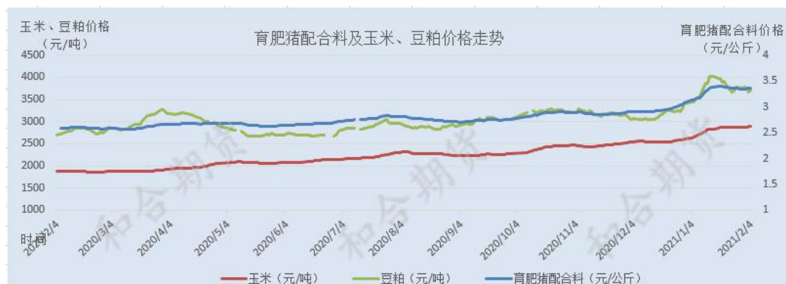
图 6 育肥猪饲料价格与玉米、豆粕价格走势

截止 2 月 4 日，全国育肥猪配合料均价为 3.36 元/公斤，与上周同期持平。但北方部分地区疫情反复，部分饲料加工企业担忧后期可能会出现物流和供应问题，普遍选择提前开始节前备货，受疫情影响下的物流运输业波及饲料行情的价格飞涨，北方现货均价普遍环比上涨 9% 左右，本质上价格行情还是受到供需关系的影响。