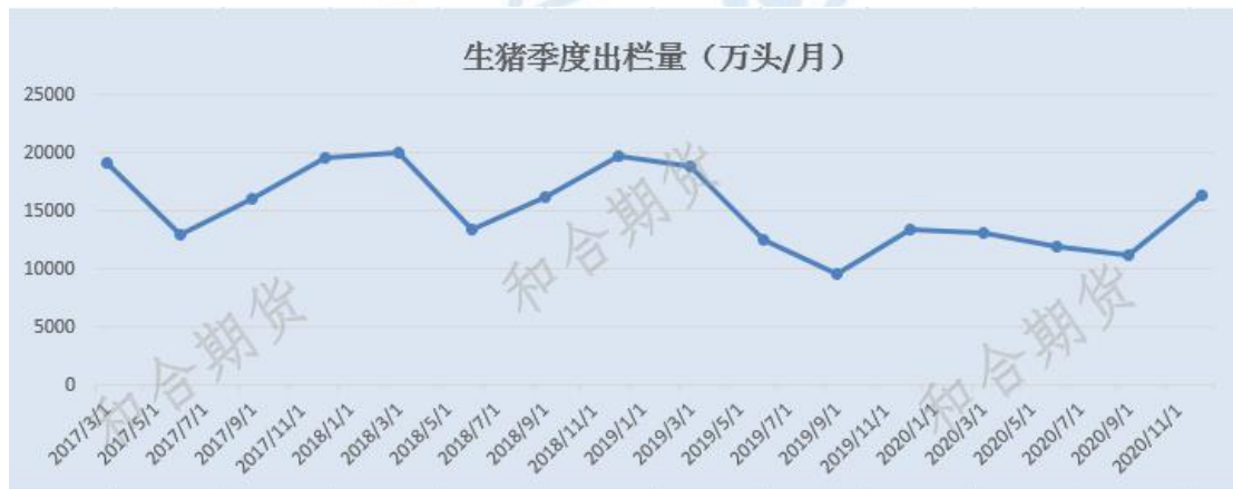
图 2 生猪季度出栏情况

除此之外，我国还加大了猪肉的进口，数据显示，2020 年我国猪肉进口总量达 430.38 万吨，同比 2019 年增加 230.96 万吨，增幅高达 115.82%。