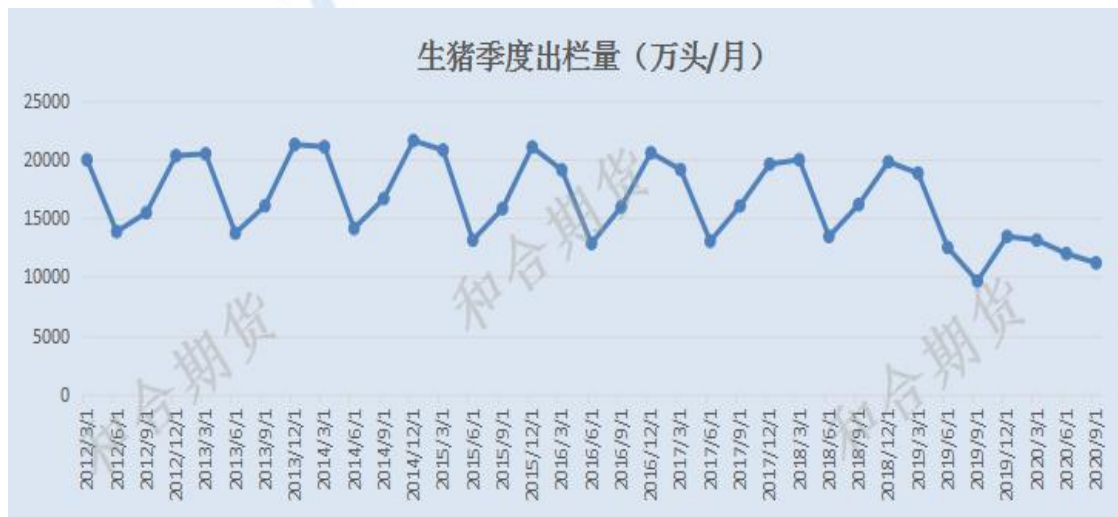
图 3 生猪季度出栏量情况