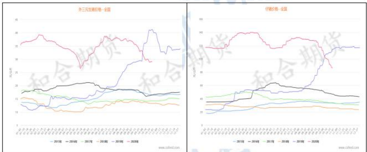
图 1 生猪现货价格及仔猪价格

截止 10 月 30 日，全国外三元生猪现货价格为 29.07 元/公斤，较 9 月底下跌 4.12 元/公斤，跌幅 12.41%；但较 10 月份最低价 28.98 元/公斤微幅上涨 0.09 元/公斤。仔猪现货价格 86.27 元/公斤，较 9 月底下跌 26.47 元/公斤，跌幅 23.47%。